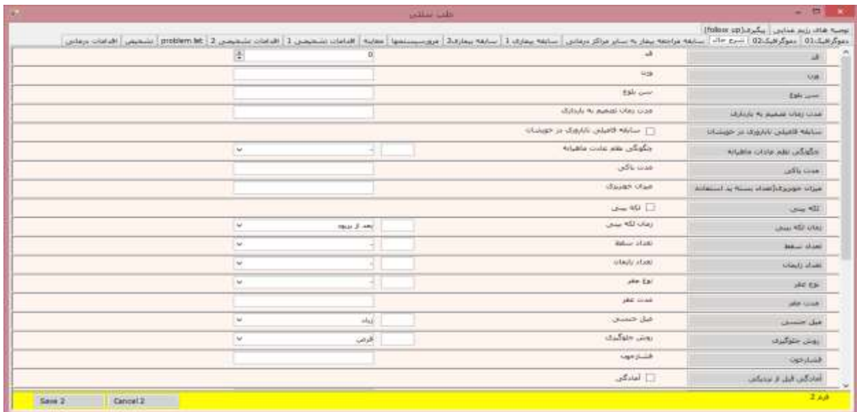
شکل ۴: صفحه شرح حال پرونده الکترونیک ناباروری با رویکرد طب سنتی

در منوی شرح حال مواردی از قبیل سن، قد، وزن، سن بلوغ، مدت زمان تصمیم به بارداری، اولیه و یا ثانویه بودن ناباروری،