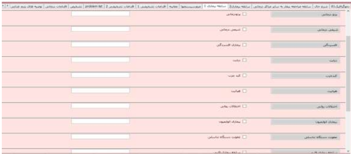
شکل ۳: صفحه سابقه بیماری پرونده الکترونیک ناباروری با رویکرد طب سنتی

سنتی وارد پرونده الکترونیک می‌شویم، یکی از مزیت‌های این قسمت انتخاب خودکار پرونده بر اساس مؤنث و مذکر بودن است. در طراحی این پرونده به ویژه در منوی شرح حال و سابقه بیماری و اقدامات تشخیصی کلیه اطلاعات مورد نیاز از نظر طب رایج و طب سنتی لحاظ شده به طوری که این پرونده دید جامع و کاملی از وضعیت بیمار به پزشک معالج می‌دهد.