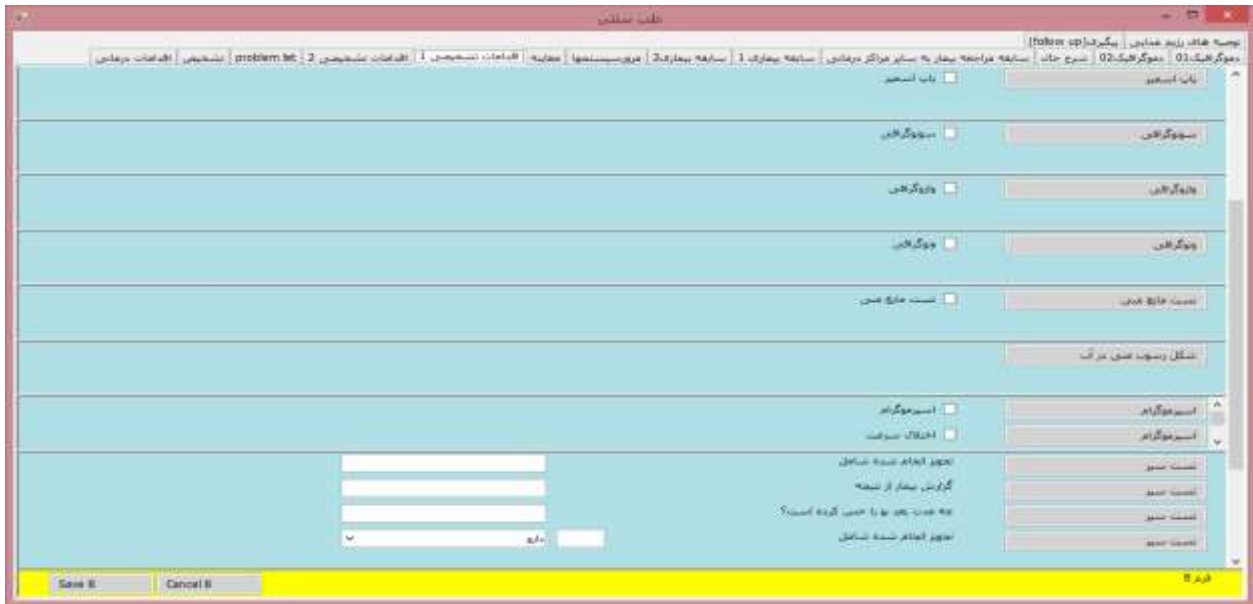
شکل ۵: صفحه اقدامات تشخیصی پرونده الکترونیک نابروری با رویکرد طب سنتی

با توجه به تراکم زیاد آیت‌ها در برخی از فرم‌ها امکانی فراهم گردید که تعداد نمایش آیت‌ها براساس نیاز کاربر تغییر کند برای مثال در فرم اقدامات تشخیصی که اقلام داده‌ای زیادی در فرم نمایش داده می‌شود کاربر می‌تواند در هر لحظه برای نمایش مثلاً ۴ آیت را انتخاب کرده و سایر آیت‌ها مخفی باشد. با کلیک بر روی هر سرویس، کل سرویس نمایش داده می‌شود (شکل ۵).