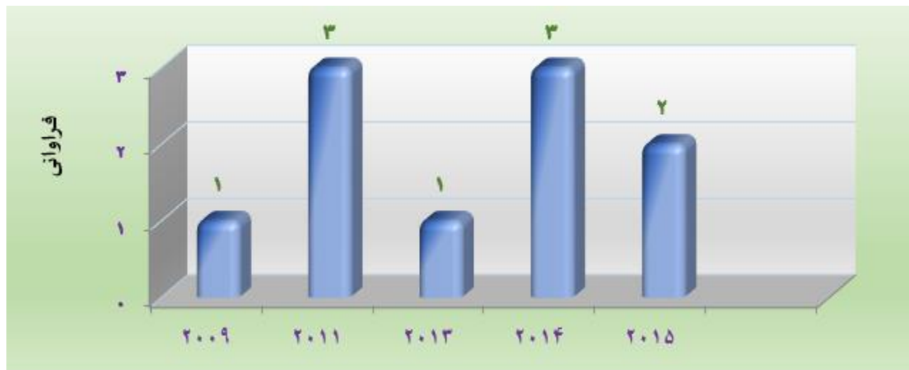
نمودار ۱: فراوانی تعداد انتشار مطالعات در خصوص استفاده از سیستم تشخیص گفتار در مستندسازی پرستاری

آمریکا و ۱ مطالعه مربوط به کانادا بود. همان‌گونه که در نمودار ۱ نشان داده شد روند انتشار مطالعات در حوزه استفاده از سیستم تشخیص گفتار در مستندسازی پرستاری پراکنده است.