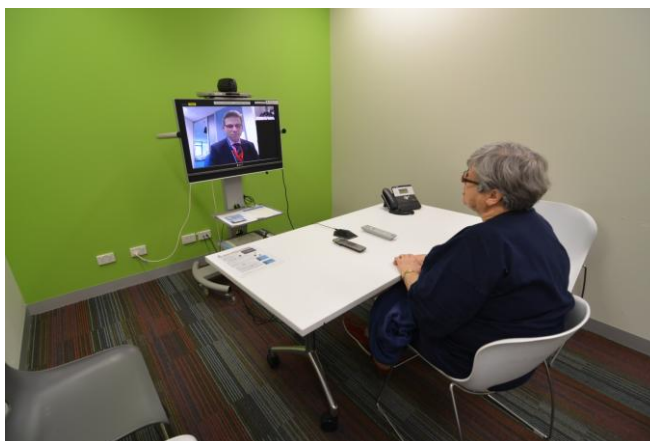
شکل ۱: استودیوی تله‌مدیسین دیابت و غدد درون‌ریز بیمارستان پرنسس الکساندرا، بریزبن، استرالیا

ایده اولیه راه‌اندازی کلینیک تله‌مدیسین از سوی رئیس بخش دیابت و غدد درون‌ریز مطرح شد و رئیس بیمارستان با آن موافقت کرد. هدف اصلی از راه‌اندازی این خدمت، صرفه‌جویی در هزینه‌های مسافرت بیماران از شهرهای دور به مرکز ایالت برای ویزیت پزشک متخصص بود. زیرساخت فنی لازم برای اجرای این طرح از سالیان پیش وجود داشت. وزارت بهداشت ایالت کوئینزلند در سراسر این ایالت یک شبکه گسترده محلی (Wide Area Network) بین بیمارستان‌ها و مراکز درمانی، راه‌اندازی کرده بود و با نصب تجهیزات استاندارد ویدئوکنفرانس، این امکان را فراهم آورده بود تا از این شبکه برای اهداف آموزشی-درمانی استفاده گردد (شکل ۱)، ولی بنا به دلایلی از این شبکه استفاده زیادی نمی‌شد. پژوهش‌های صورت گرفته در همین مرکز نشان داد که پزشکان متخصص غدد درون‌ریز عقیده داشتند بخش قابل توجهی از ویزیت‌های بیماران دیابتی می‌تواند از راه دور انجام شود [۵].