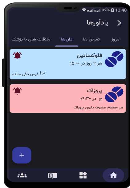
شکل ۴: صفحه یادآورها

تخصص در زمینه اختلال استرس پس از سانحه بود. ارزیاب دوم دارای دکترای انفورماتیک پزشکی و بیش از ۱۰ سال در حوزه تولید و فناوری‌های اطلاعاتی و ارتباطی در حوزه بهداشت و درمان بود. ارزیاب سوم، کارشناس ارشد انفورماتیک پزشکی با سابقه امور پژوهشی مرتبط و همچنین طراحی و ارزیابی اپلیکیشن سلامت همراه بود. ارزیاب چهارم، کارشناس ارشد