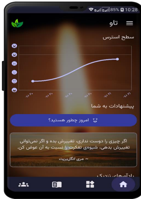
شکل ۳: صفحه اصلی اپلیکیشن