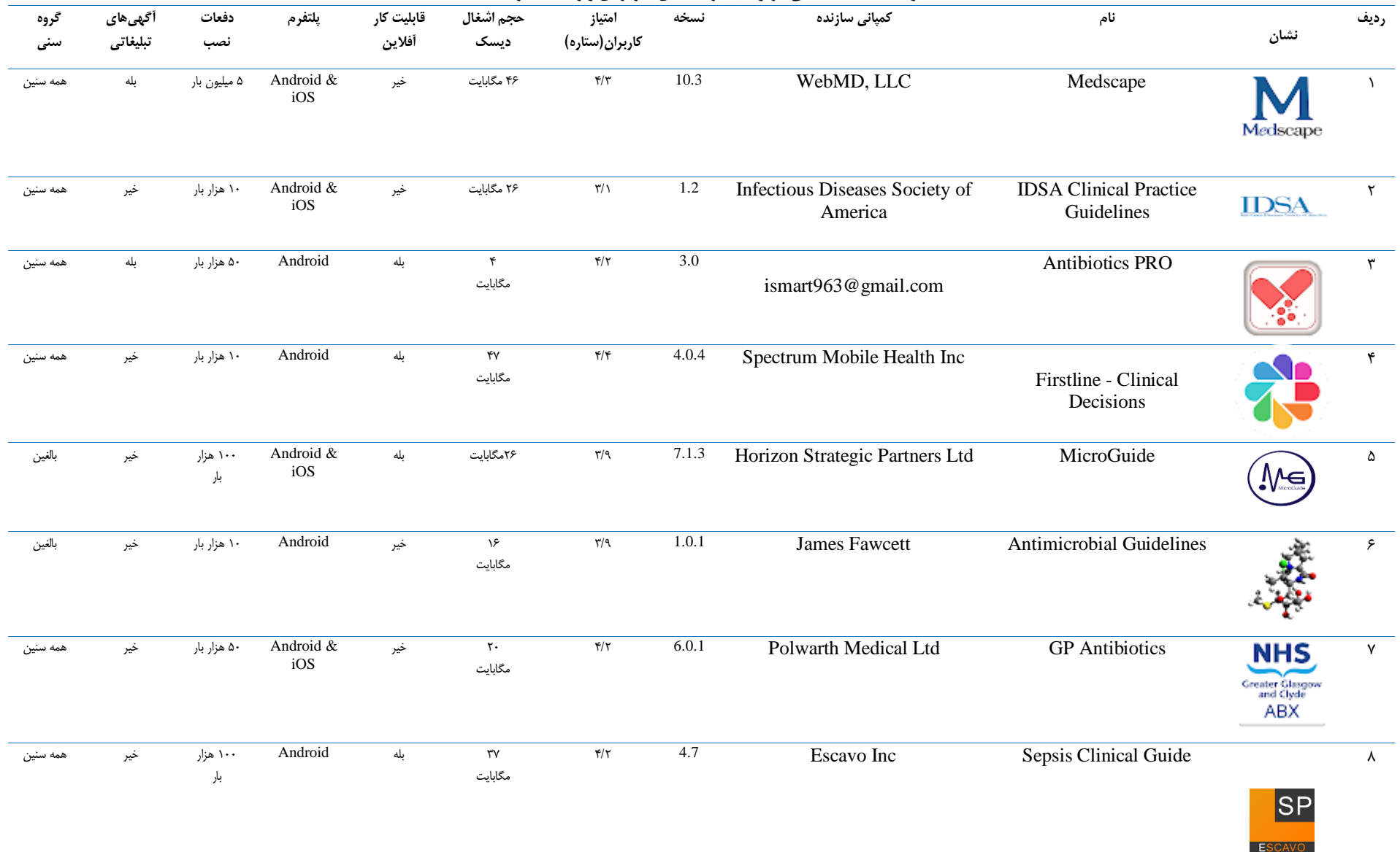
جدول ۲: اطلاعات کلی مربوط به برنامه‌های کاربردی وارد شده در مطالعه