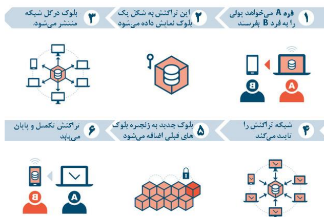
شکل ۱: بلاکچین چگونه کار می‌کند [۱۱]

بلاکچین به صورت یک دفتر دیجیتالی و غیرمتمرکز معاملات است، که متشکل از یک شبکه نظیر به نظیر [Peer Peer to] و یک پایگاه داده توزیع شده می‌باشد [۸-۶]. تأثیر این فناوری به عنوان هسته اصلی در پشت بیت کوین، درک محققان در حوزه‌های مختلف را دگرگون کرده است [۹]. بانک اطلاعاتی بلاکچین به طور فزاینده‌ای ثبت معاملات را جمع‌آوری و آن‌ها را در بلوک‌هایی که دارای مهر زمان و رمزنگاری شده با بلوک‌های قبلی هستند، ذخیره می‌کند [۱۰]. مطابق شکل ۱، عملکرد بلاکچین را می‌توان بر اساس ۶ گام بیان کرد [۱۱].