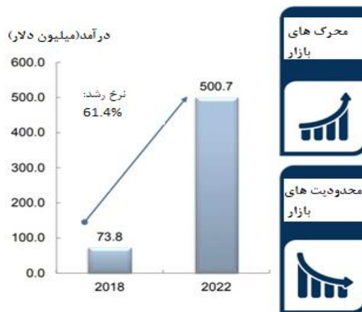
شکل ۲: فناوری بلاکچین در بهداشت و درمان ۲۰۲۲-۲۰۱۸ [۳۱]

[۲۵]؛ اما باوجود تمامی این مزایا و کاربردهای عنوان شده، در این مسیر به دلیل حاکم بودن فرآیندهای سنتی در سلامت و نیاز به تغییر در ساختارهای موجود، استفاده از این فناوری، با مخاطراتی نیز همراه است [۲۶،۲۷]. همچنین، تغییر و تحول ناشی از به کارگیری بلاکچین در این سازمان‌ها، نیازمند آمادگی است و این فاکتور می‌تواند شرایط پذیرش و پیاده‌سازی یا عدم پذیرش آن را فراهم نماید [۲۸]. طبق پیش‌بینی مؤسسه گارتنر،