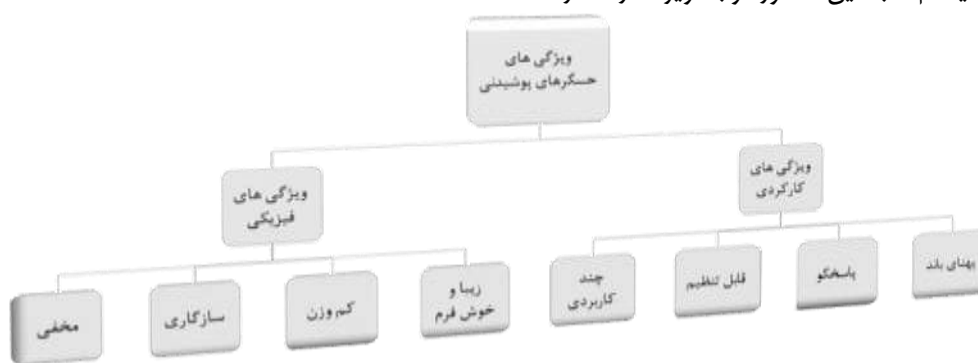
شکل ۲: ویژگی‌های سیستم‌های پوشیدنی

حال حاضر اغلب حس‌گرهای پوشیدنی درون لباس‌ها و لوازم جانبی افراد مخفی شده و همراه آن‌ها یکپارچه می‌شوند. در ادامه ویژگی‌های کارکردی سیستم‌ها اشاره به چند کارکردی بودن، قابلیت تنظیم با برنامه‌های مورد نیاز کاربران، قابلیت پاسخ‌گویی دارد. سیستم‌های تک کارکردی در کاربردهای عملی و پایش پارامترهای متنوع قابل استفاده نیستند به همین دلیل سیستم‌های چند کارکردی در حوزه سلامت مفیدتر می‌باشند. ویژگی قابلیت پاسخ‌گویی در هر زمان و مکانی مفهوم "همیشه در دسترس" را حمایت می‌کند. شکل ۲ مختصری در مورد ویژگی‌های سیستم‌های پوشیدنی می‌باشد [۱۱،۱۰].