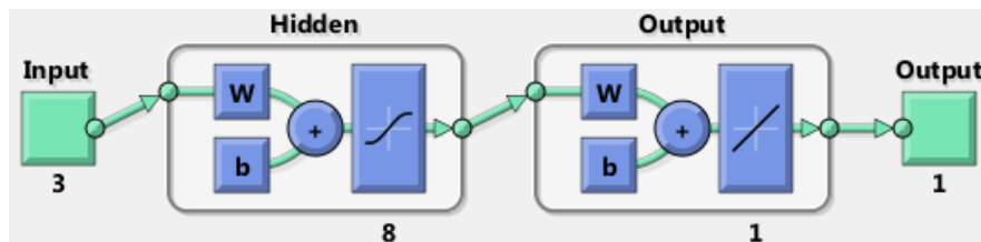
شکل ۲: بهترین معماری شبکه

درک برای انسان از روابط موجود در یک مجموعه داده‌ای هستند و پیش‌بینی خود را در قالب قوانینی که از نظر پارامترهای آماری برازش مناسبی دارند ارائه می‌کنند. این روش یادگیری برای توابع گسسته و داده‌های خطادار به کار می‌رود و به کشف دانش کمک می‌کند [۲۶]. درخت تصمیم یکی از ابزارهای داده‌کاوی در ارتباط با حل مشکلات بیماری‌ها در دنیای واقعی درخت تصمیم DT (Decision Tree) است. درخت تصمیم مجموعه داده‌های دیابت را طبقه‌بندی می‌کند. یک درخت تصمیم‌گیری یک مدل طبقه‌بندی مناسب با استفاده از مجموعه‌ای از داده‌ها می‌باشد [۲۷] ویژگی‌ها از میان مجموعه‌ای از داده‌ها برای کمک به تصمیم‌گیری استخراج می‌شوند. توزیع کلاس به صورت کلاس با مقدار ۱ به معنی ابتلا به دیابت بارداری و کلاس ۰ به معنی دیابت حاملگی منفی می‌باشد. مراحل الگوریتم درخت تصمیم‌گیری به شرح زیر است: پس از وارد کردن ورودی‌ها از مجموعه داده‌ها، برای هر ویژگی اطلاعات حاصل از تقسیم بر روی آن ویژگی را نمایش داده و بهترین را از میان صفات پیدا می‌نماید. در نتیجه انتخاب گره تصمیم‌گیری و تقسیم بر روی یک الگوریتم بازگشتی بر روی زیر شاخه‌ها و تقسیم شدن شاخه‌ها در بهترین ویژگی انجام شده و آن گره به عنوان گره فرزند به درخت اضافه می‌شود [۲۴]. در این مقاله، از الگوریتم درخت تصمیم C4.5 برای داده‌کاوی استفاده شده است. داده‌کاوی هسته مرکزی فرآیند کشف دانش از پایگاه داده KDD (Knowledge Discovery in Database) می‌باشد که به پیدا کردن الگوها و قواعد از بین پایگاه داده‌های بزرگ کمک می‌کند [۲۸]. درخت تصمیم قوانین تصمیم‌گیری و