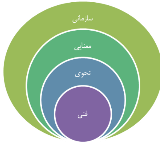
شکل ۱: سطوح هم‌کنش‌پذیری

از هم‌کنش‌پذیری امکان یکپارچه‌سازی فرآیندهای کسب‌وکار و جریان کاری فراتر از مرزهای یک سازمان مورد بررسی قرار می‌دهد [۲]. هم‌کنش‌پذیری سازمانی به معنای توانایی سازمان‌ها برای ارتباط مؤثر و انتقال معنادار داده (اطلاعات)