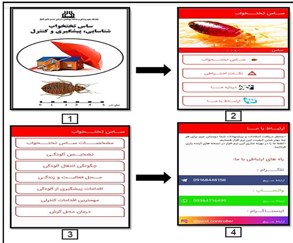
شکل ۱: نمایی از صفحات اصلی نرم افزار آموزشی «شناسایی، پیشگیری و کنترل ساس تختخواب»