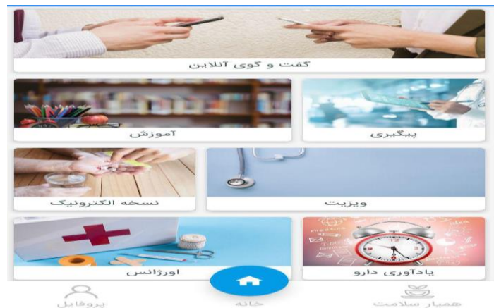
شکل ۱: صفحه اصلی سیستم پیگیری آموزش محور بیماران قلبی

بر اساس نتایج حاصل از نیازسنجی سیستم پیگیری آموزش محور بیماران قلبی بر پایه سلامت همراه طراحی و کد نویسی این برنامه با استفاده از زبان جاوا تحت سیستم عامل اندروید و با برنامه اندروید استودیو پیاده‌سازی گردید. این سیستم در یک نسخه طراحی شده است ولی کاربران بر اساس نقش (پزشک، بیمار و مدیر سیستم) با استفاده از