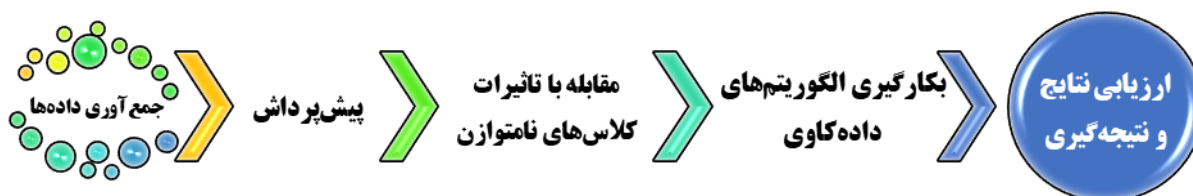
شکل ۱: فرآیند اجرای روش پیشنهادی برای بررسی تأثیر سوابق بیماری والدین در پیش‌بینی خطر ابتلاء به بیماری فشارخون بالا در فرزندان

همکاران [۱۸] برای تعیین ابتلای فرد به فشارخون بالا استفاده شد. علاوه‌براین، در برخی موارد مقادیر فشارخون سیستولیک و دیاستولیک برای بیماران ثبت نشده داده‌های گم‌شده (Missing Data) و صرفاً به درج تشخیص براساس آن‌ها بسنده شده است. از این‌رو، این دو ویژگی نیز از مجموعه ویژگی‌ها حذف شدند.