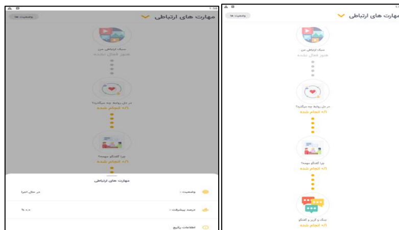
قابلیت مشاهده میزان پیشرفت در هر تمرین برای کاربران