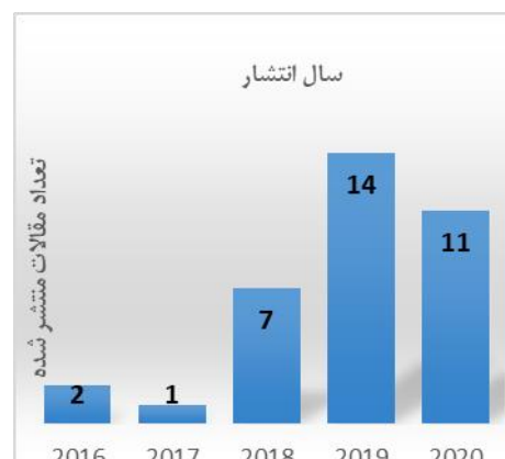
نمودار ۱: تعداد مقالات منتشر شده در هر سال

بیشترین تعداد مقالات در سال ۲۰۱۹ منتشر شده بود (نمودار ۱).