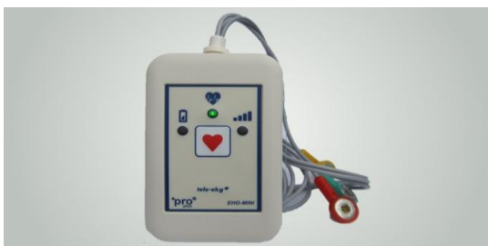
شکل ۱: یک نمونه از دستگاه Tele E.C.G

یکی از پرکاربردترین انواع سیستم‌های پزشکی از راه دور سیستم Tele E.C.G می‌باشد که نوعی Tele Cardiology است و در دو دهه اخیر کاربرد بسیار زیادی داشته است. Tele E.C.G حوزه بسیار وسیعی از برنامه‌های کاربردی را در بر می‌گیرد [۱۴]. با توجه به گستره جغرافیایی وسیع کشور، دارا بودن جمعیت روستایی زیاد، کمبود منابع و پزشکان متخصص در این مناطق و فاصله جغرافیایی بسیار زیاد با مراکز مجهز به امکانات بهداشتی- درمانی پیشرفته، استفاده از Tele Cardiology و مخصوصاً Tele E.C.G (شکل ۱) که یکی از مهم‌ترین کاربردهای آن می‌باشد بسیار کمک کننده و سودمند خواهد بود؛ در همین راستا در این مقاله ضمن تشریح مفهوم Tele E.C.G، کاربردها، زیرساخت‌ها و اهمیت استفاده از آن نیز مورد بحث و بررسی قرار گرفته است.