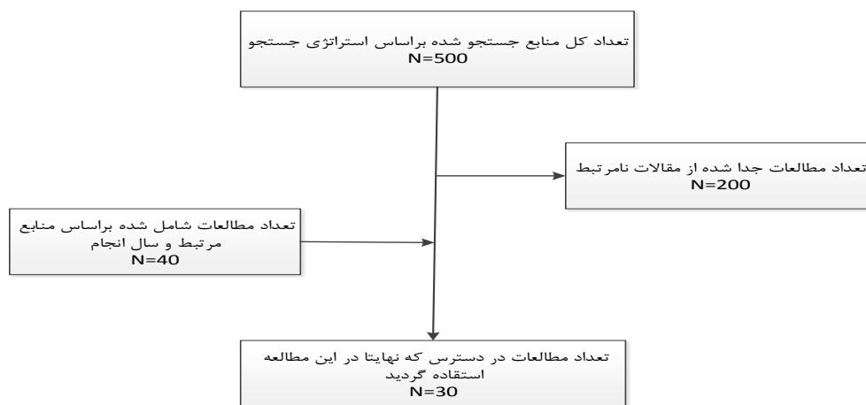
شکل ۲: استراتژی جستجوی منابع

نیز جمع‌آوری گردید. جستجو برای منابع مرتبط با نقش فن‌آوری Tele E.C.G در نظام سلامت از ۲۰۰۵ تا ۲۰۱۵ میلادی انجام گردید و نتایج جستجو بر اساس ارتباط آن‌ها با موضوع مطالعه بررسی گردید. لازم به ذکر است اطلاعات یافت شده درباره دستگاه Tele E.C.G از ۳۰ مقاله مرتبط مورد بررسی استخراج شدند و بر اساس اهداف پژوهش خلاصه‌سازی و گزارش شدند. شکل ۲ استراتژی جستجو و دستیابی به منابع را نمایش می‌دهد.