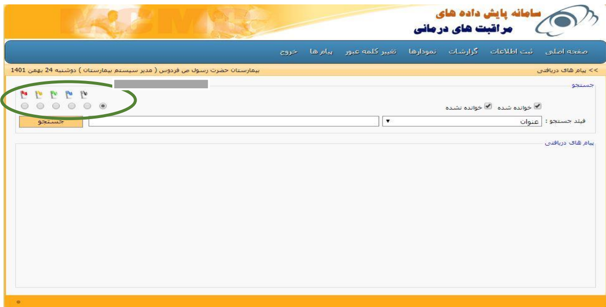
شکل ۴: نمونه‌ای از مشکلات مربوط به نقض اصل زیبایی‌شناسی و طراحی حداقل

مؤلفه راهنمایی و مستندسازی در اکثر قسمت‌های سیستم رعایت شده بود. یکی از مثال‌های عدم رعایت این مؤلفه نامفهوم بودن و عدم توضیح استفاده از رنگ‌های مختلف پیش‌بینی شده در