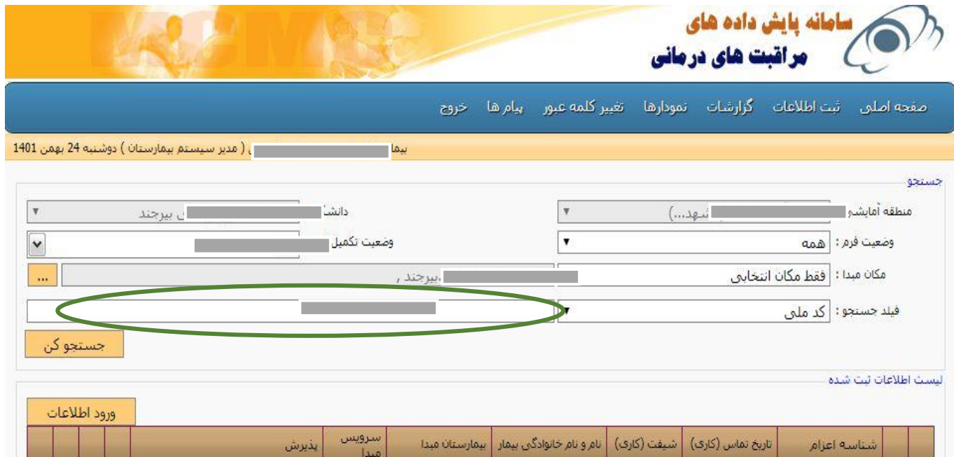
شکل ۳: نمونه‌ای از مشکلات مربوط به نقض اصل زیبایی‌شناسی و طراحی حداقل

قسمت پیام‌ها بود که درجه شدت ۲ رابه خود اختصاص داد (شکل ۴).